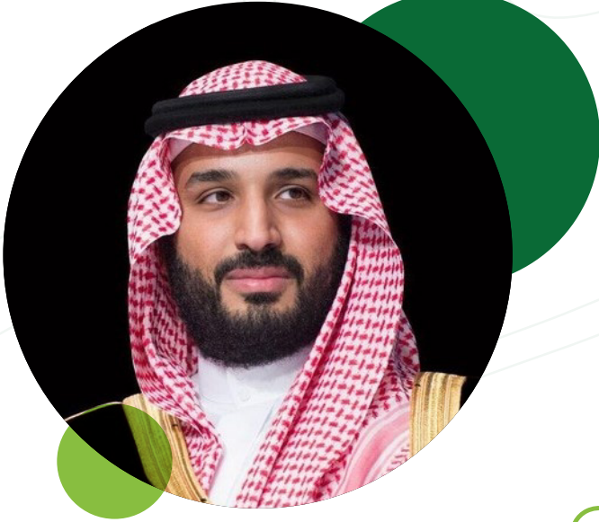
صاحب السمو الملكي

الأمير محمد بن سلمان بن عبدالعزيز آل سعود